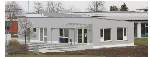
Das neue Jugendhaus an der Grundschule

Wer sich das neue Jugendhaus neben der Schule ansehen möchte - das sowohl als Jugendtreff, als auch vom Kinderhort genutzt wird-, hat dazu am Samstag, 7. Mai, ab 14 Uhr beim Tag der offenen Tür Gelegenheit. Dabei kann man sich auch Kaffee und Kuchen, Würstchen vom Grill und kühle Getränke schmecken lassen.