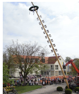
2011: Der Maibaum wird aufgestellt

Am 1. Mai findet ab 10 Uhr das traditionelle Maibaumfest auf dem Rathausplatz statt. Nachdem der alte Maibaum schon drei Jahre stand, wird heuer wieder ein neuer Baum aufgestellt.