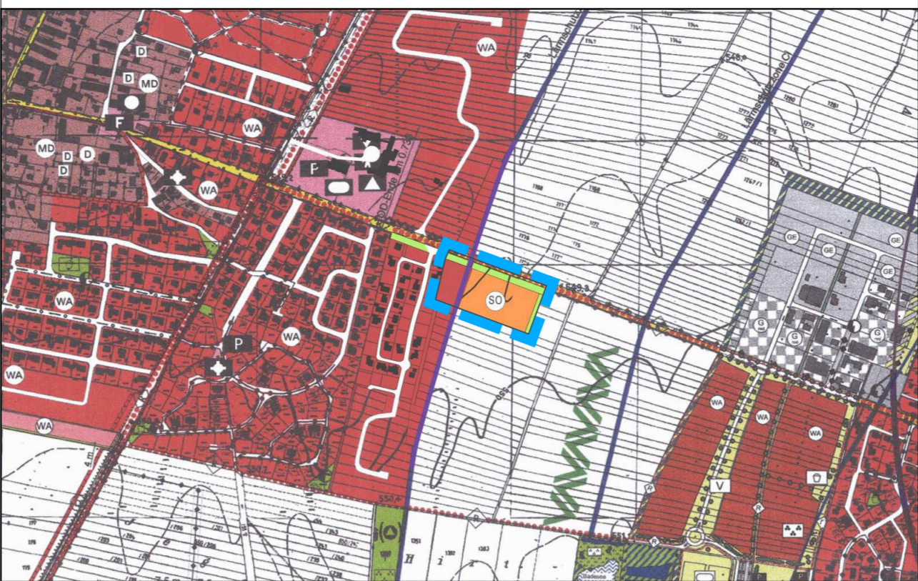
FLÄCHENNUTZUNGSPLAN M 1:10.000

© Landesamt für Vermessung und Geoinformation